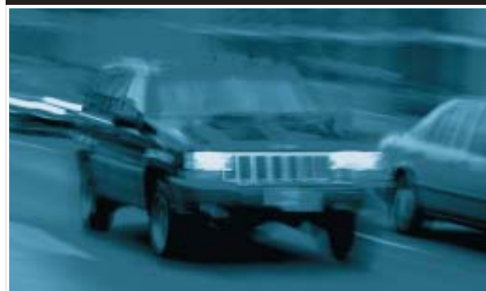
Clifford beveiligd auto's, maar bovenal de inzittenden.

Kortom U heeft Tracenet gevonden, zodat Tracenet uw auto terug zal vinden. Vraag uw leverancier voor meer informatie en de diverse abonnementsvormen.